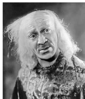
Михоэлс в самой знаменитой своей роли короля Лира

Какой-нибудь из них, светящей сквозь туман, Ты боль свою отдашь, и гнев, и человечность. Пред ликом Вечности ни страшных этих ран, Ни муки не стыдись. Пускай Стыдится Вечность!"